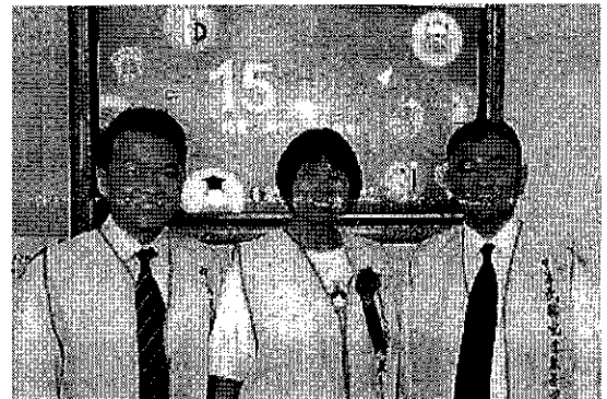
台北市長柯文哲先生、希望基金會董事長-紀政女士 參加「認養失業家庭學童運動」