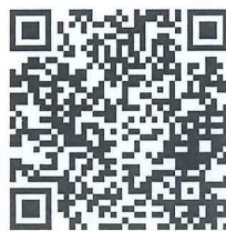
官方 Line 帳號