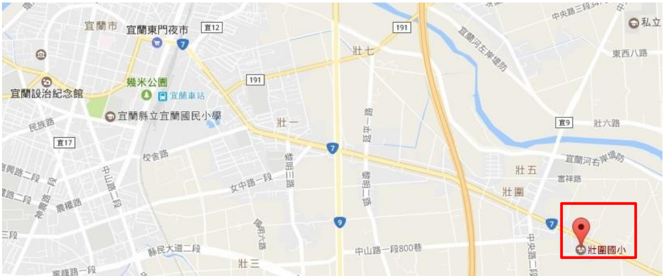
宜蘭縣壯圍國小 105 學年度校舍平面圖