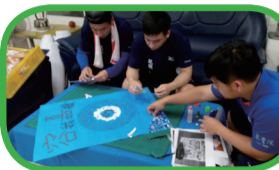
幫模範生做競選海報

雖然說我們班級人數是目前全校最少的，但是我們班的同學都會自我要求，奮發向上，彼此之間會互相幫助。在班上，我們很珍惜彼此的相處時光以及生活中的點點滴滴；在運動場上，我們總是全力以赴，屢次為學校爭光。我們深信榮譽、尊嚴要靠平時努力認真的練習來換取。二愛，加油！