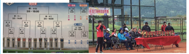
107 年高中棒球聯賽第四循環抽籤結果 107 年縣長盃三級棒球錦標賽開幕籤籤結果

本校棒球隊參加 107 年高中木棒組棒球聯賽打進 12 強之列，是今年宜花東唯一進入第四循環的球隊也是宜花東成績最好的球隊，另外本校參加本縣 107 年度縣長盃高中棒球錦標賽再度獲得冠軍衛冕成功，完成三連霸的成績更取得縣內王貞治盃選拔賽的代表權。