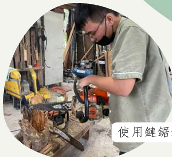
使用鏈鋸進行雕刻