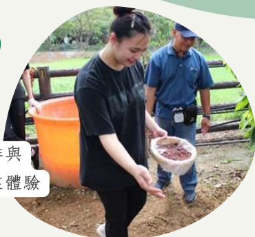
部落咖啡與 紅藜產業體驗