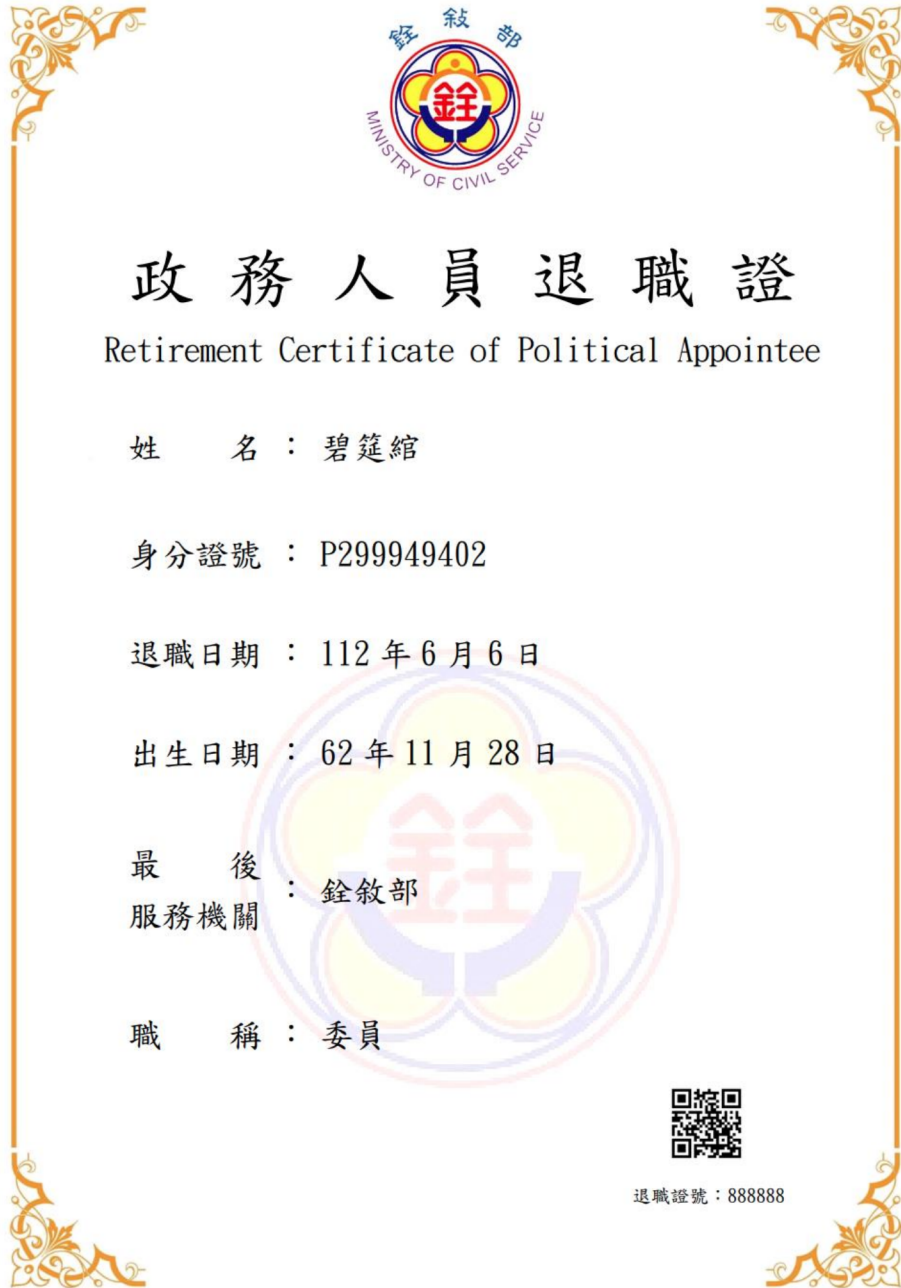
圖 9 政務人員退職證測試圖樣(範例)