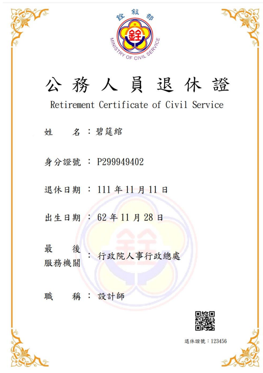
圖 8 公務人員退休證測試圖樣(範例)