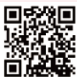
《運動場館工作人員引導身心障礙者之服務手冊》