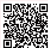
《兒童共融遊戲場設計參考手冊》