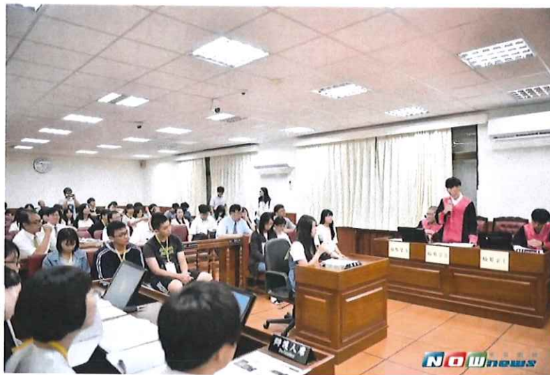
每一位同學都卯足全力進行訊問，就像是真實的法庭狀況（, 2017. 07. 28）