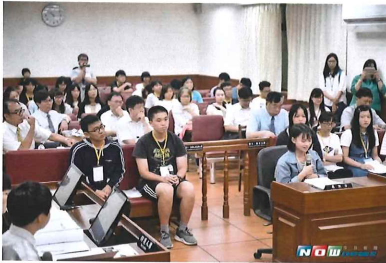
從被告到審判長，全都由學生擔任，評審則為法庭經驗豐富的庭長、檢察官與律師，讓模擬法庭更具說服（, 2017. 07. 28）