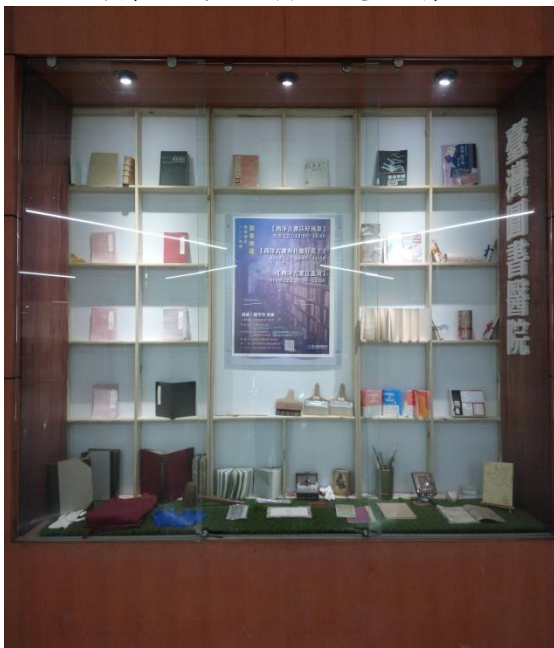
一樓大廳閱讀櫥窗-1(共 4 個)