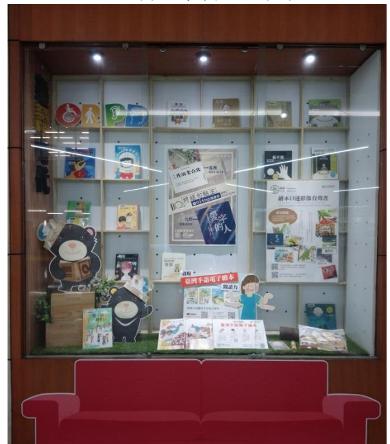
一樓大廳閱讀櫥窗-2(共 4 個)