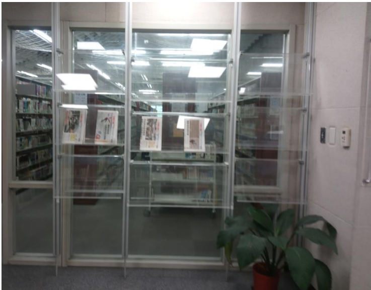
三樓青少年悅讀區雙向書展架