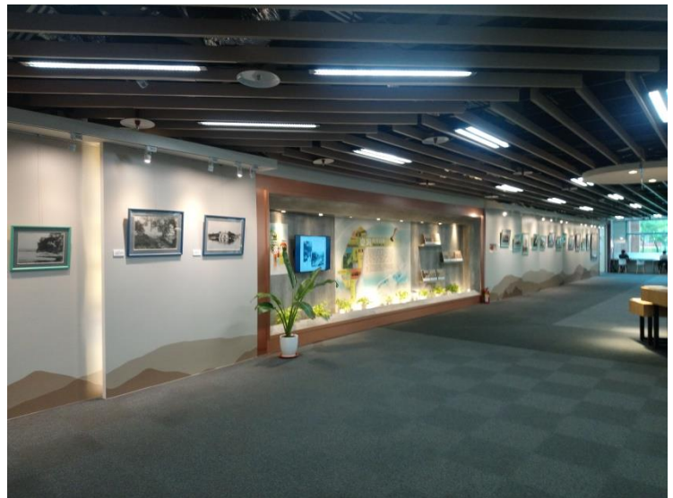
一樓臺灣藝文走廊