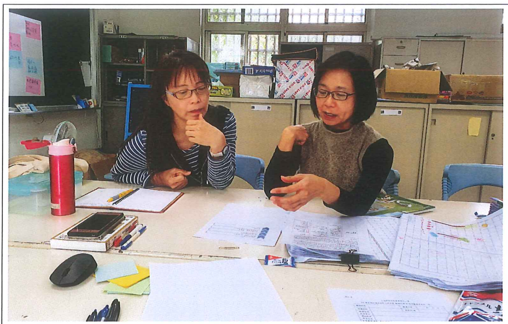
活動：課程共備 日期：109. 3. 12 10:30-11:10