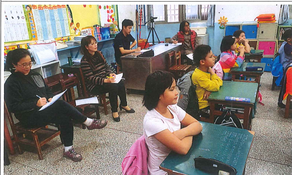
活動：公開觀課 日期：109. 3. 18 10:30-12:00