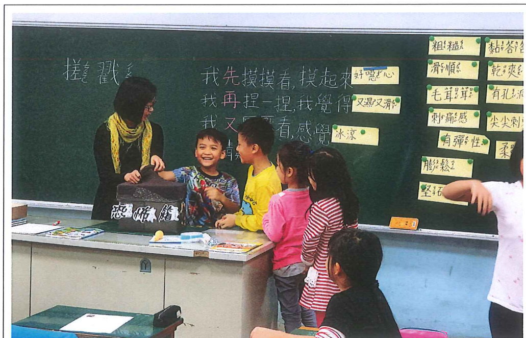
活動：公開觀課 日期：109. 3. 18 10:30-12:00