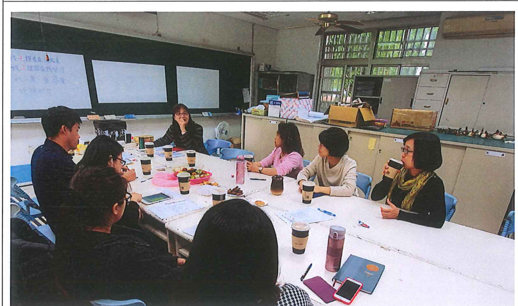
活動：議課及回饋 日期：109. 3. 18 13:30-16:00