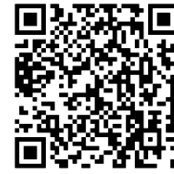
宜花 DOC FB 粉絲專頁