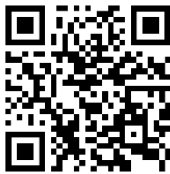
線上報名 小攝影師徵件平台