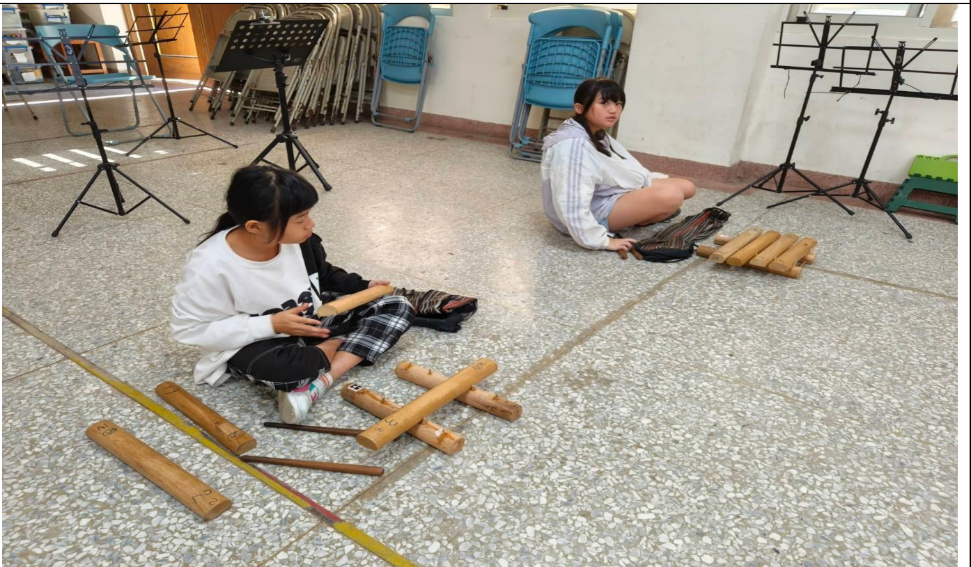
相片2說明：校訂課程進行太魯閣族傳統木琴教學。