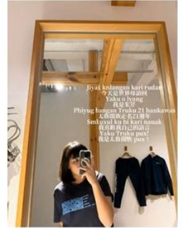
相片2說明：以上是701班學生的作品，每一位都用族語說話做宣導的影片。每隔班級有阿美、太魯閣族、閩南、布農族、泰雅族、海岸阿美等族群憶起使用自己的族語推廣自己的語言。