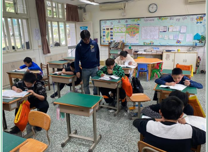
日期：112年7月(暑期) 課業輔導