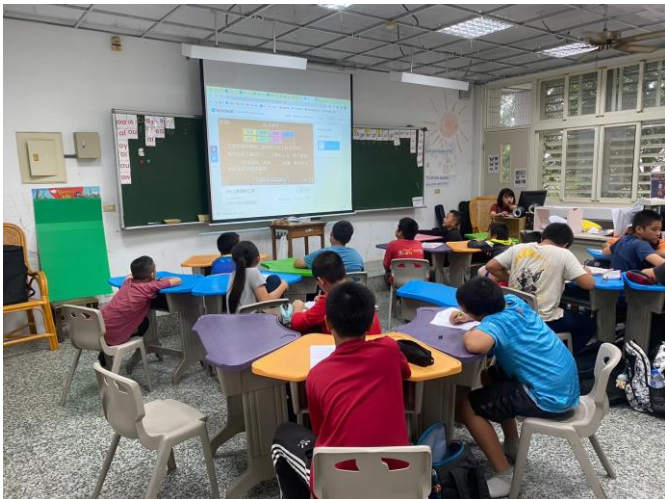
日期：112年7月(暑期) 課業輔導