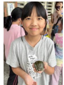
我們難得擁有的食尚小玩家