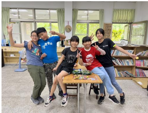
慶生會~~大家一起同樂的時光 ya!