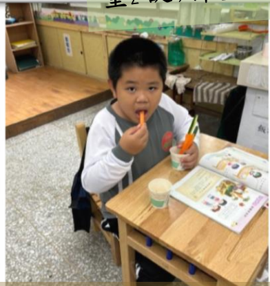
吃平常不敢吃的食物