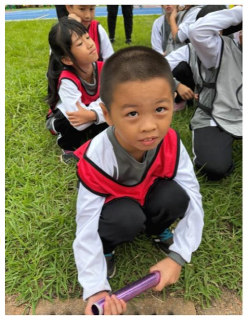
我一定要跑第一名!