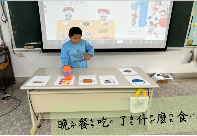
晚餐吃了什麼食物?