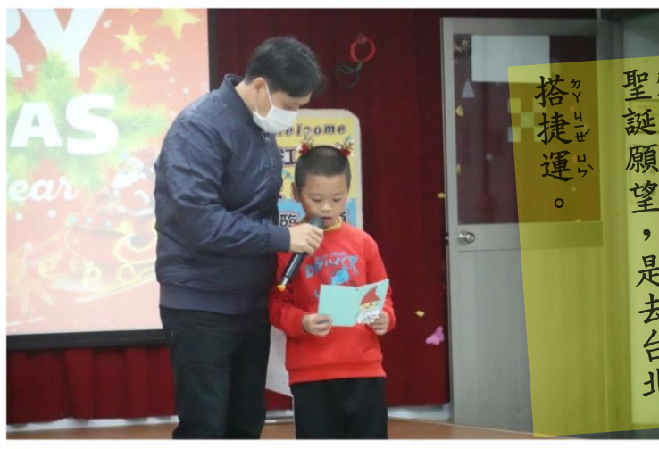
聖誕願望，是去台北 搭捷運。