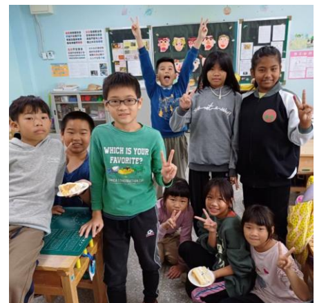
四年甲班可愛的活動照片~~~運動會、慶生會