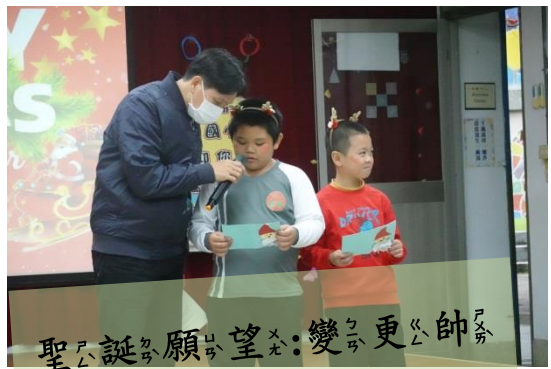
聖誕願望：變得更帥