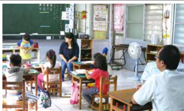
校長入班參與聊書活動