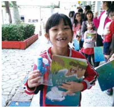
兌換希望閱讀禮物