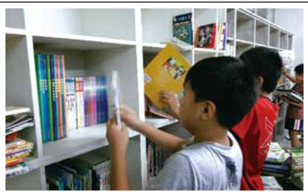
圖書小志工上架圖書