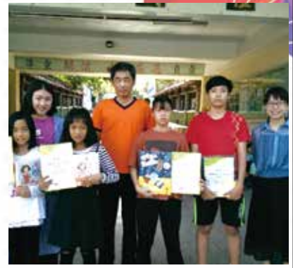
圖文小作家入選頒獎