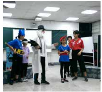
故事媽媽培訓學生戲劇演出