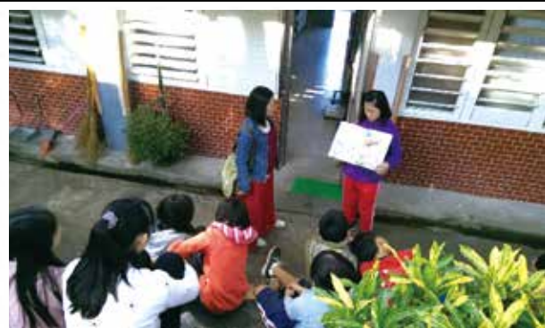
故事媽媽到校陪伴