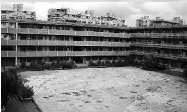
圖二 思賢中庭原有空間水泥地