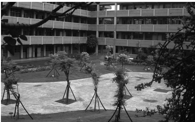
圖四 完工後的中庭綠地景觀美如畫