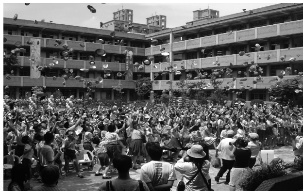
圖五 畢業典禮在如花園般的中庭舉行備 感溫馨