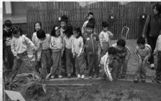
圖八 小朋友在老師指導下對新花園做觀察探索，各個興趣盎然。