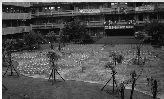
圖三 改造後的中庭空間植栽與綠地，曲線柔美