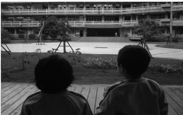
圖六 敲除圍牆後的木平台，視野寬闊，學童快樂進出，暢通無阻。