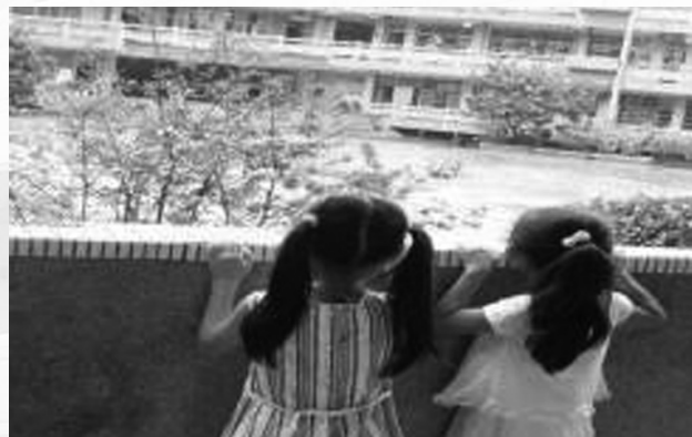
圖七 圍牆未敲除前，阻礙了學童視野，需墊腳方能見到中庭景觀，也限制了兒童的活動。