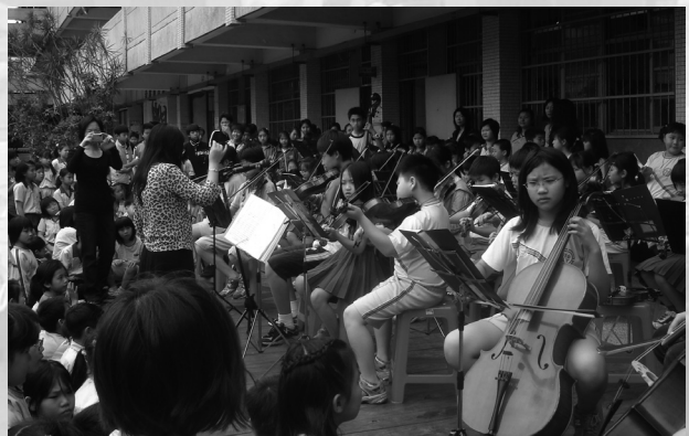
圖九 在平台舉辦音樂欣賞活動學童熱情 參與