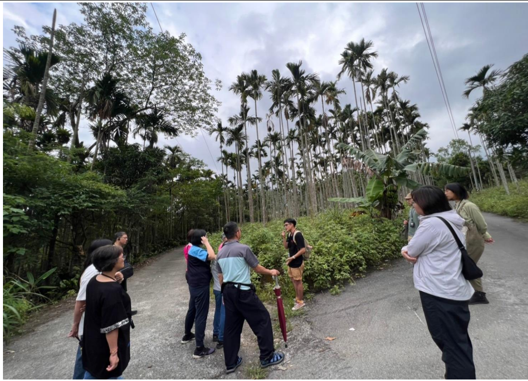
說明：部落導覽傳說故事及遺蹟