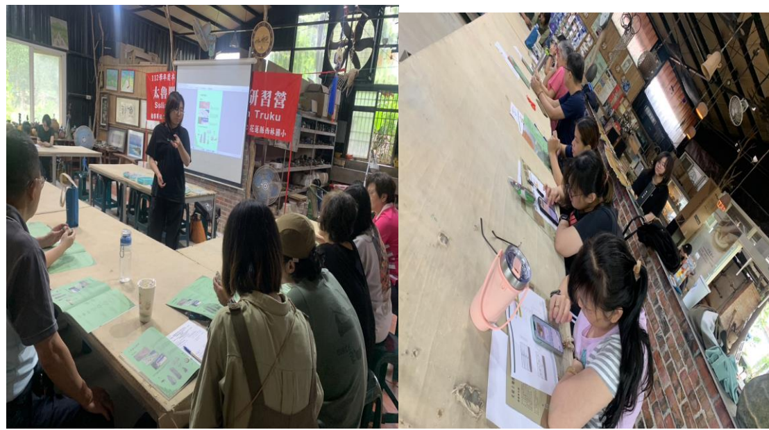
說明：考古尋寶遊戲及考古實物