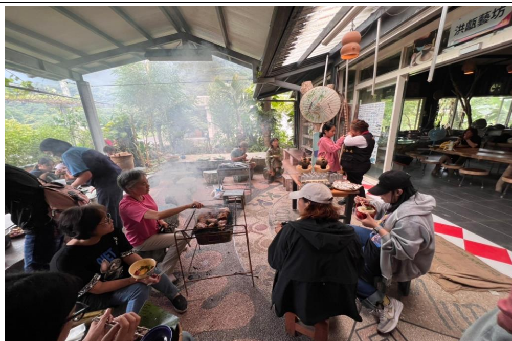
說明：部落傳統美食分組製作