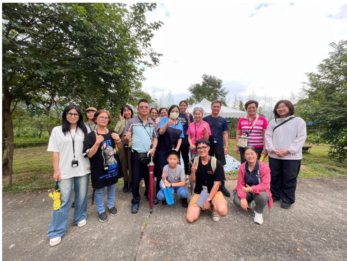
說明：考古遺址探訪