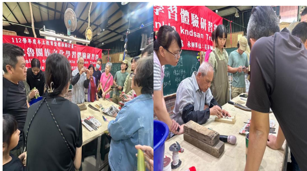
說明：推廣始祖哈尤牧師口簧琴製作教學